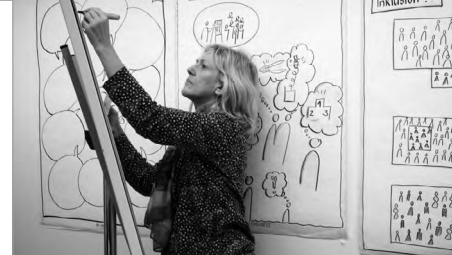
◀ Interne Weiterbildung für KursleiterInnen: Visualisieren – Bilder statt Worte

Im Mai 2016 führten wir zusammen mit insieme Region Baden-Wettingen und dem Behindertensport Wettingen den 2. insieme