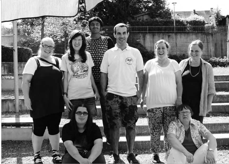
▲ Treffen der Ideen-Gruppe Bildungsclub Aargau

nung, dass sie nicht zwischen freiwilligen Angeboten, bei denen man jederzeit aus der Aktivität aussteigen kann, und verbindlichen Kursangeboten unterscheiden konnte. Ihr Kontrollzwang war in der ihr gewohnten Umgebung oft stärker, als die Faszination, einen Kurs zu absolvieren. Es war auch mit unterstützter Kommunikation nicht möglich, die «Spielregeln» für einen solchen Kursbesuch im Voraus zu erklären oder zu fragen, ob sie an einem Kurs teilnehmen möchte. Weil die Frau sehr gerne malt, wurde 2016 ein neuer Anlauf unternommen. Ihre Betreuungspersonen meldeten sie für einen Malkurs des Bildungsclubs an, der ausserhalb ihrer Institution angeboten wurde. Mit Begleitung nahm die Frau an diesem Kurs teil. Sie war mit grosser Begeisterung und Konzentration dabei. Dies hielt den ganzen Kurs über an und ihr Kontrollzwang war in dieser Zeit nicht wahrzunehmen. Eine tolle und befreiende Erfahrung für alle Beteiligten!